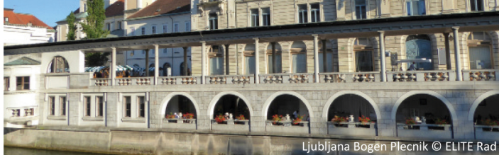
Ljubljana Bogen Plecnik